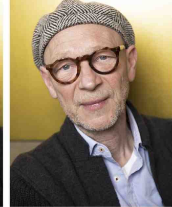
van mens die op het podium rechtstreeks tot jou spreekt, geeft je de mogelijkheid om jezelf te vergeten.'