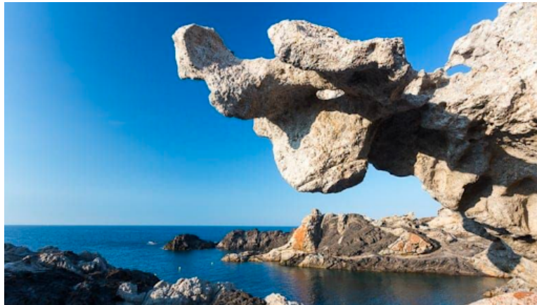
Rotsen aan de Costa Brava