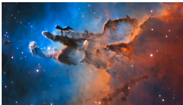
De Pilaren der Schepping